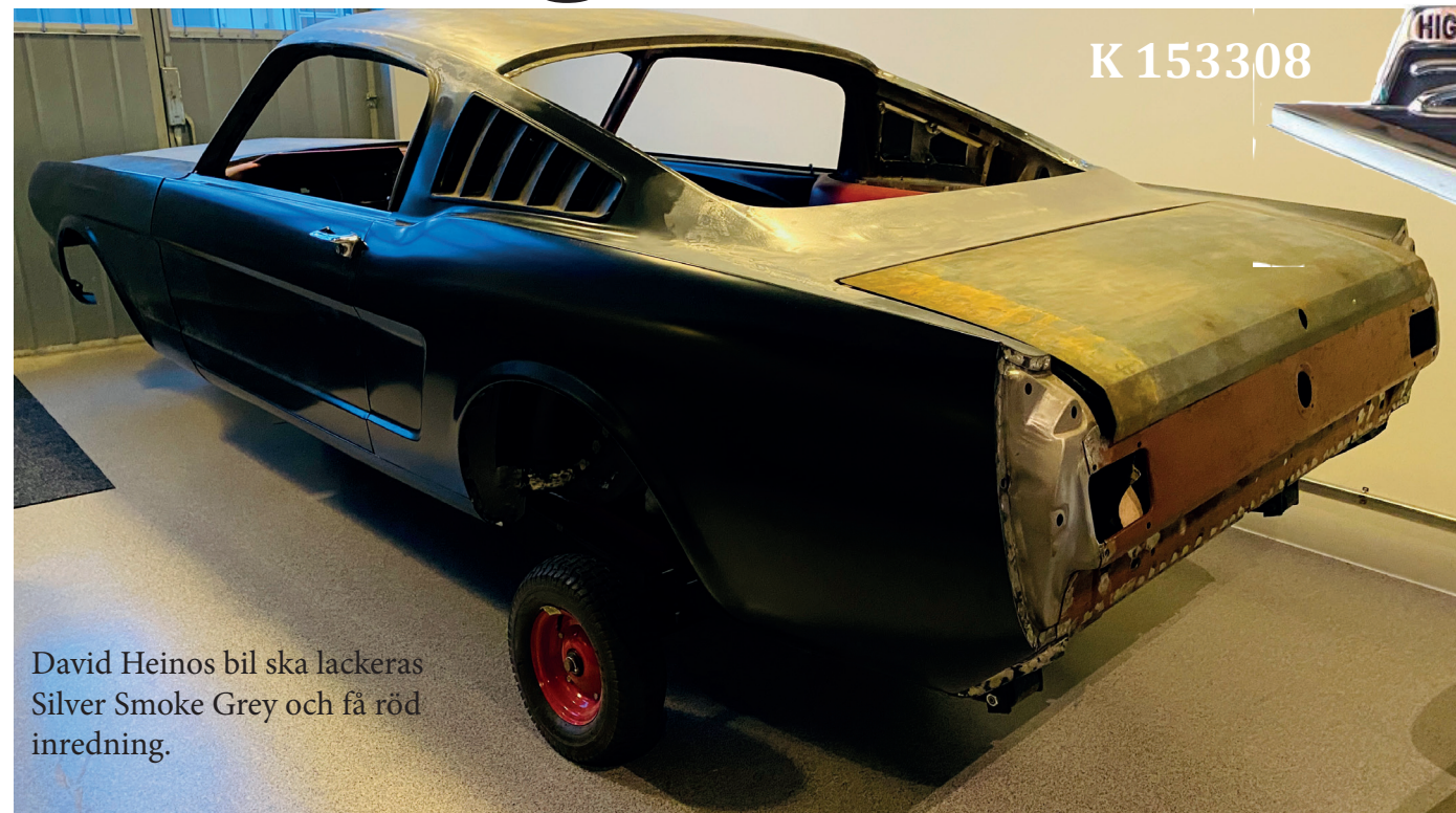
David Heinos bil ska lackeras Silver Smoke Grey och få röd inredning.

na på 60-talet. Om du vet mer om får du gärna kontakta mig så för-FWP826 med VIN 5T09 K153308 medlar jag kontakten,