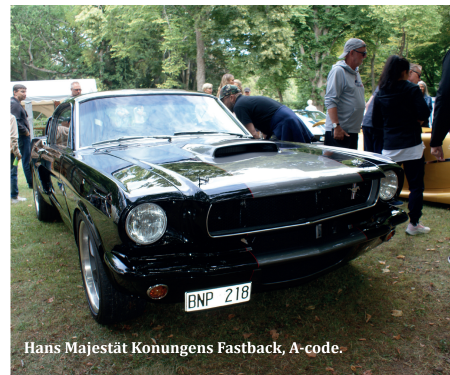
Hans Majestät Konungens Fastback, A-code.